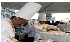
Il 2 ottobre è il #Polloarrostopday, piatto simbolo della nonna - Terra & Gusto