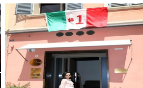
L'Espresso, 7 ristoranti al 'top' conquistano i 5 cappelli - Terra & Gusto