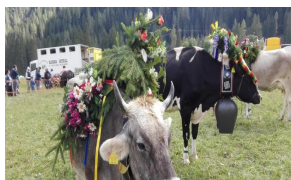
La 'Se Desmonteghea', festa della transumanza a Falcade - Terra & Gusto